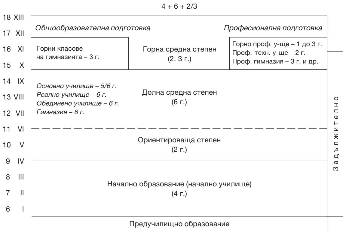
СХЕМА № 2. Структура на училищната система в ГЕРМАНИЯ